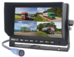
D16134 Accessoires systèmes filaires - Écran 7" AHD fractionné