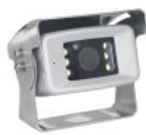
D16133 Accessoires systèmes filaires - Caméra Inox HD 1080P