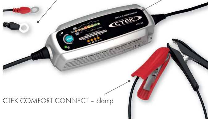
CTEK COMFORT CONNECT - clamp

Vollständige Batteriepflege – einzigartiges und patentiertes System für die Wiederbelebung, Ladung und Erhaltungsladung aller Blei-Säure-Batterietypen zur Maximierung der Leistung und zur Verlängerung der Batterielebensdauer.