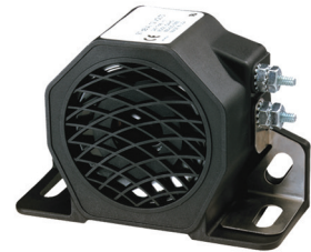
630110 Alarme sonore de recul standard 82-102Db - 12/24V