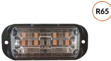
D16004 ● Feu de pénétration orange 12/24V R65 class 1 - R10