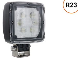
D14880 Phare de travail homologué recul 12/24V R10 CISPR25 Classe 5